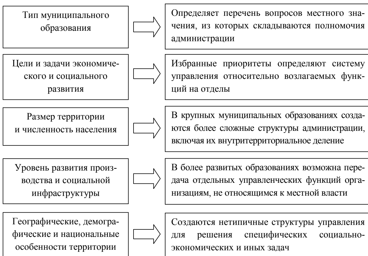
Рис. 1. Схема структуры управления на муниципальном уровне во взаимосвязи функций и органов управления