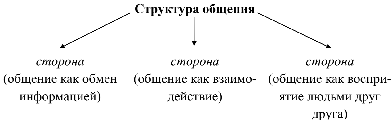
Схема № 7

Дайте научные определения сторонам общения юриста.